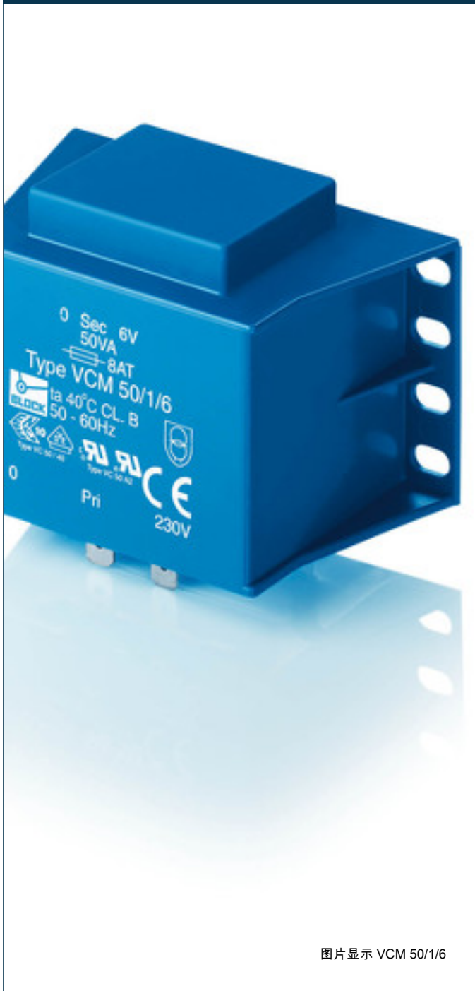
图片显示 VCM 50/1/6