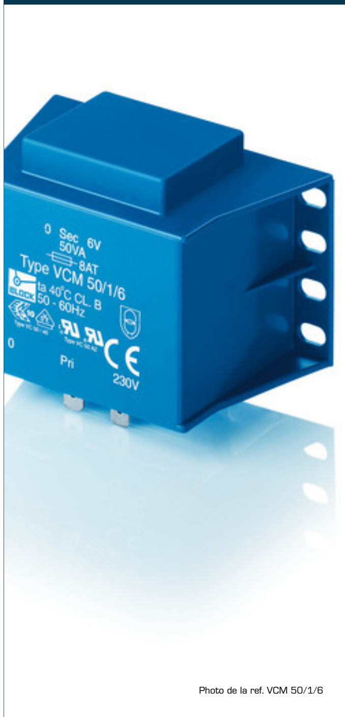
Photo de la ref. VCM 50/1/6