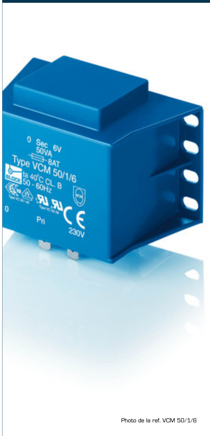
Photo de la ref. VCM 50/1/6