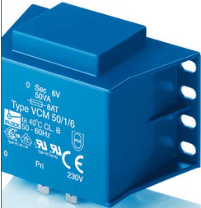
图片显示 VCM 50/1/6