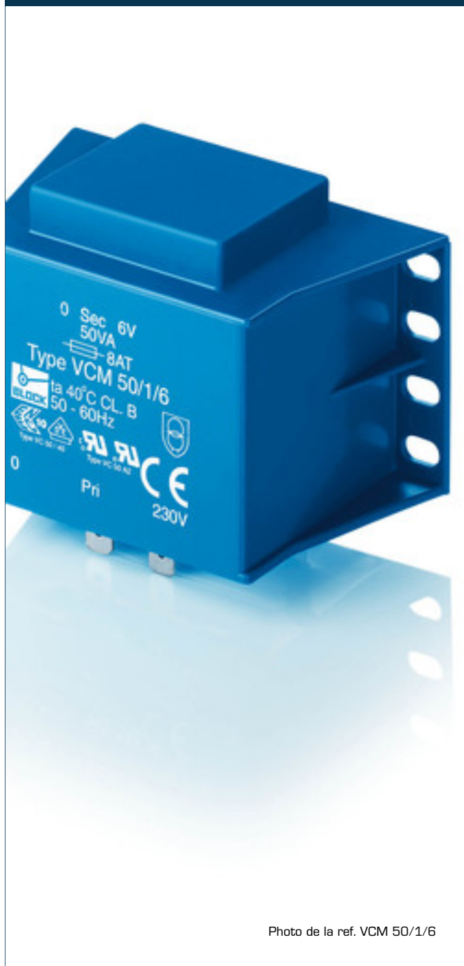
Photo de la ref. VCM 50/1/6