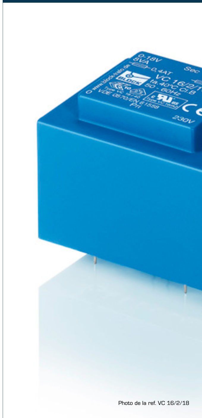
Photo de la ref. VC 16/2/18