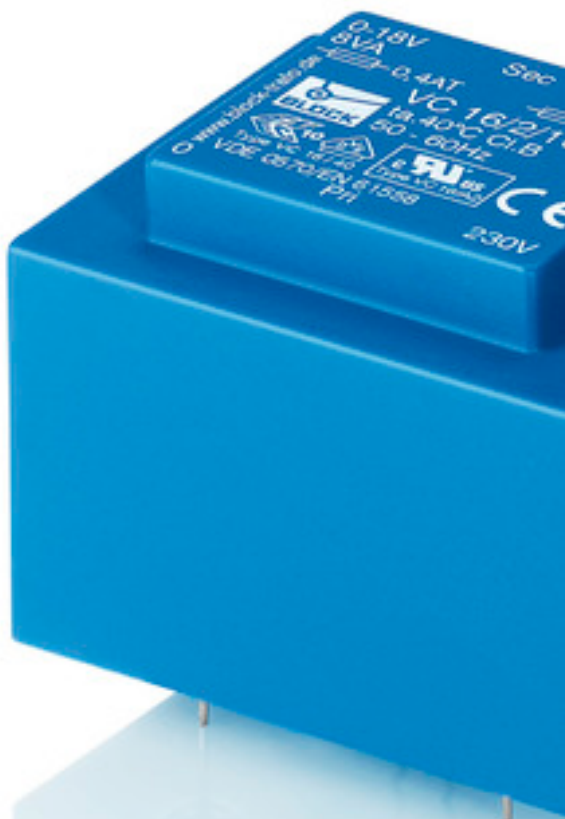
Abbildung zeigt VC 16/2/18