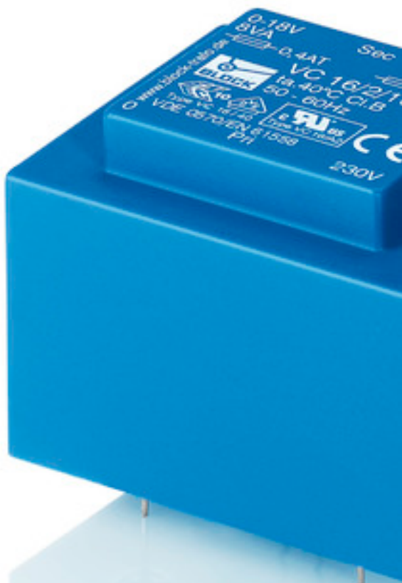
Photo de la ref. VC 16/2/18