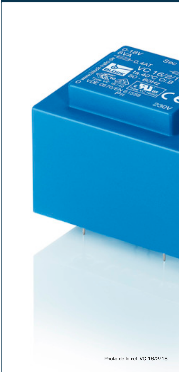
Photo de la ref. VC 16/2/18