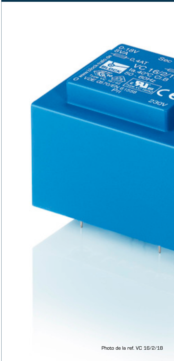
Photo de la ref. VC 16/2/18