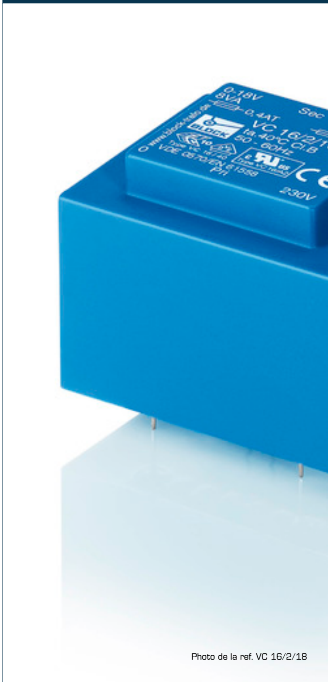
Photo de la ref. VC 16/2/18