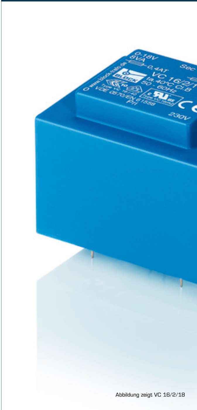
Abbildung zeigt VC 16/2/18