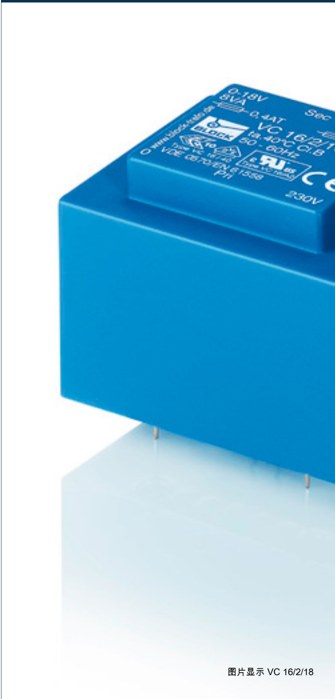
图片显示 VC 16/2/18