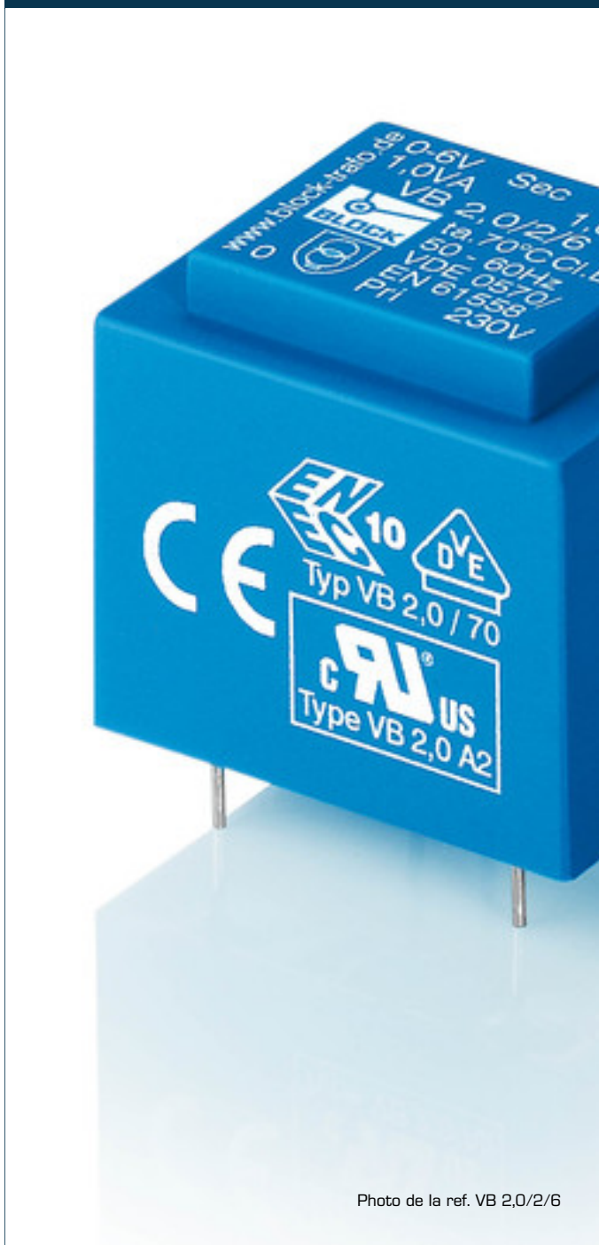
Photo de la ref. VB 2,0/2/6