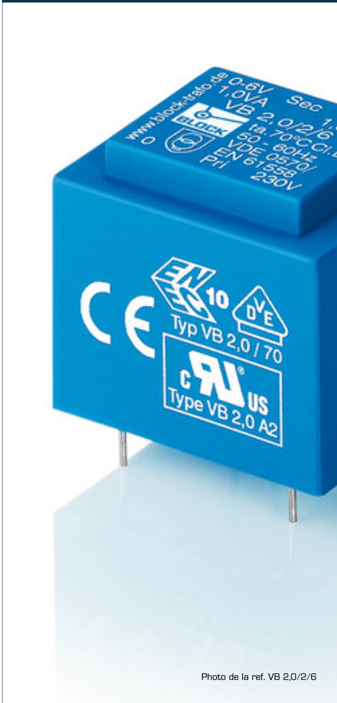
Photo de la ref. VB 2,0/2/6