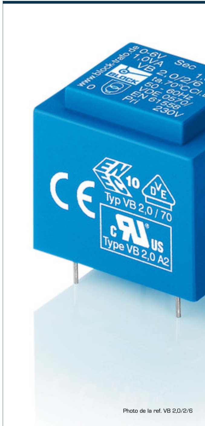
Photo de la ref. VB 2,0/2/6