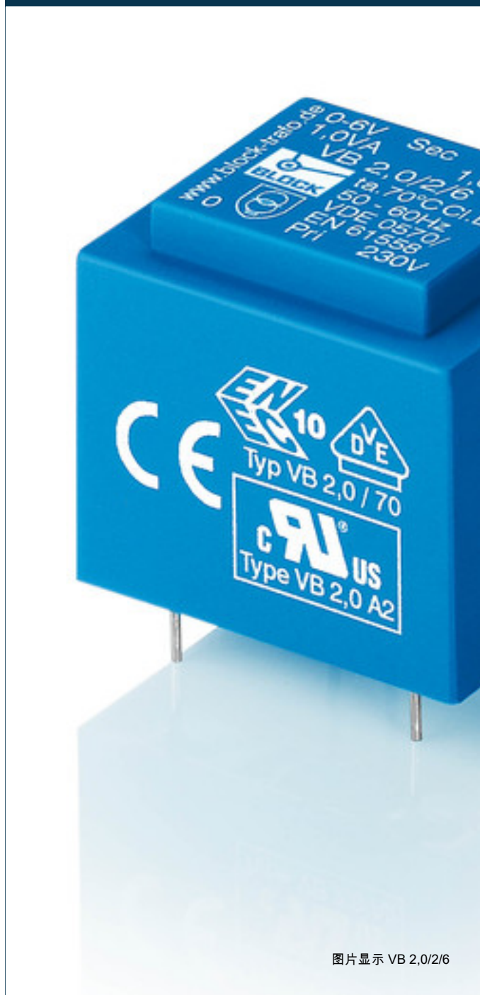
图片显示 VB 2,0/2/6