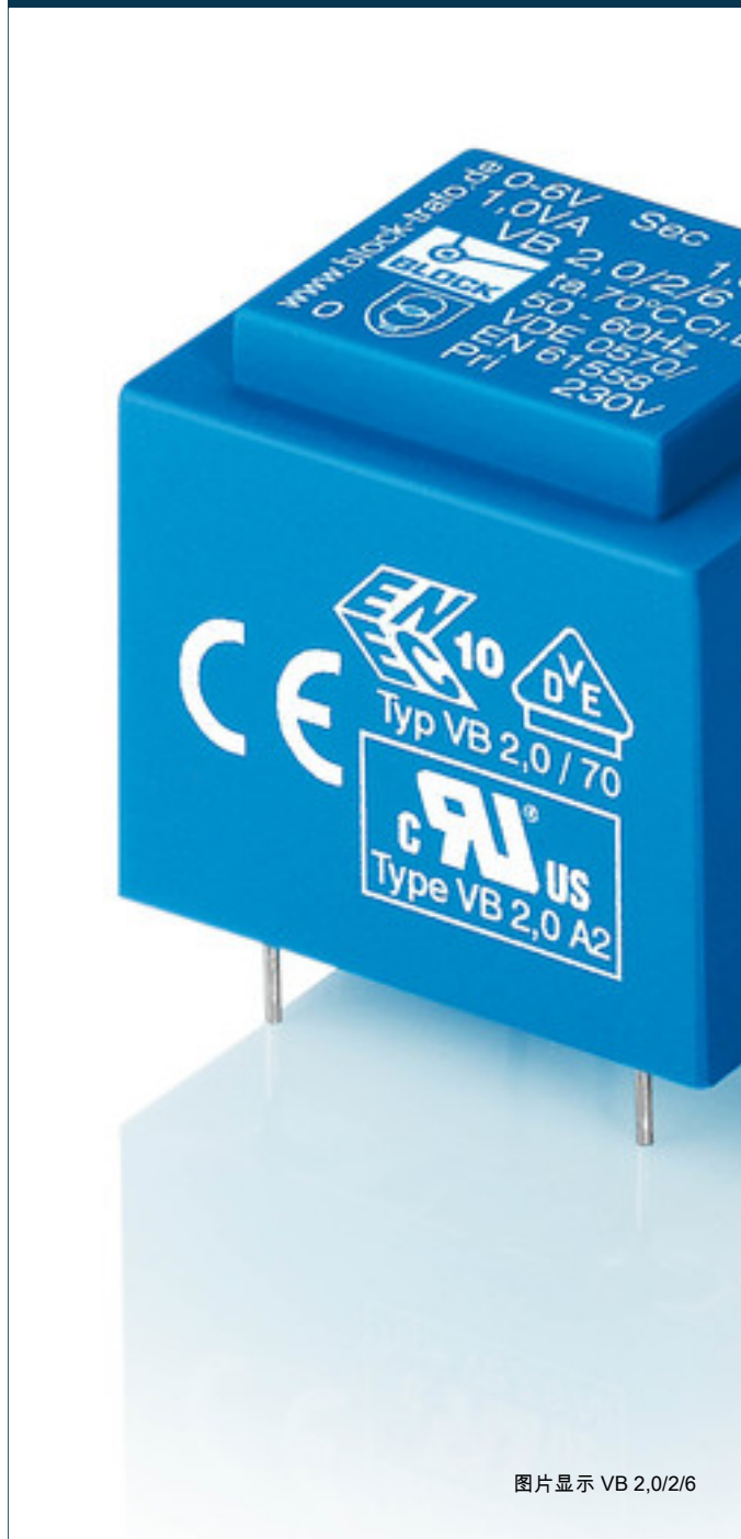
图片显示 VB 2,0/2/6