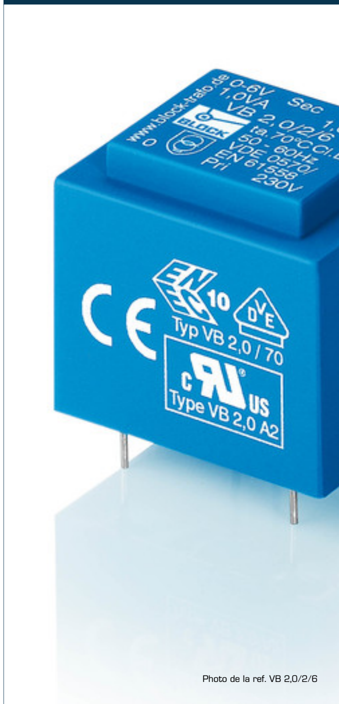
Photo de la ref. VB 2,0/2/6