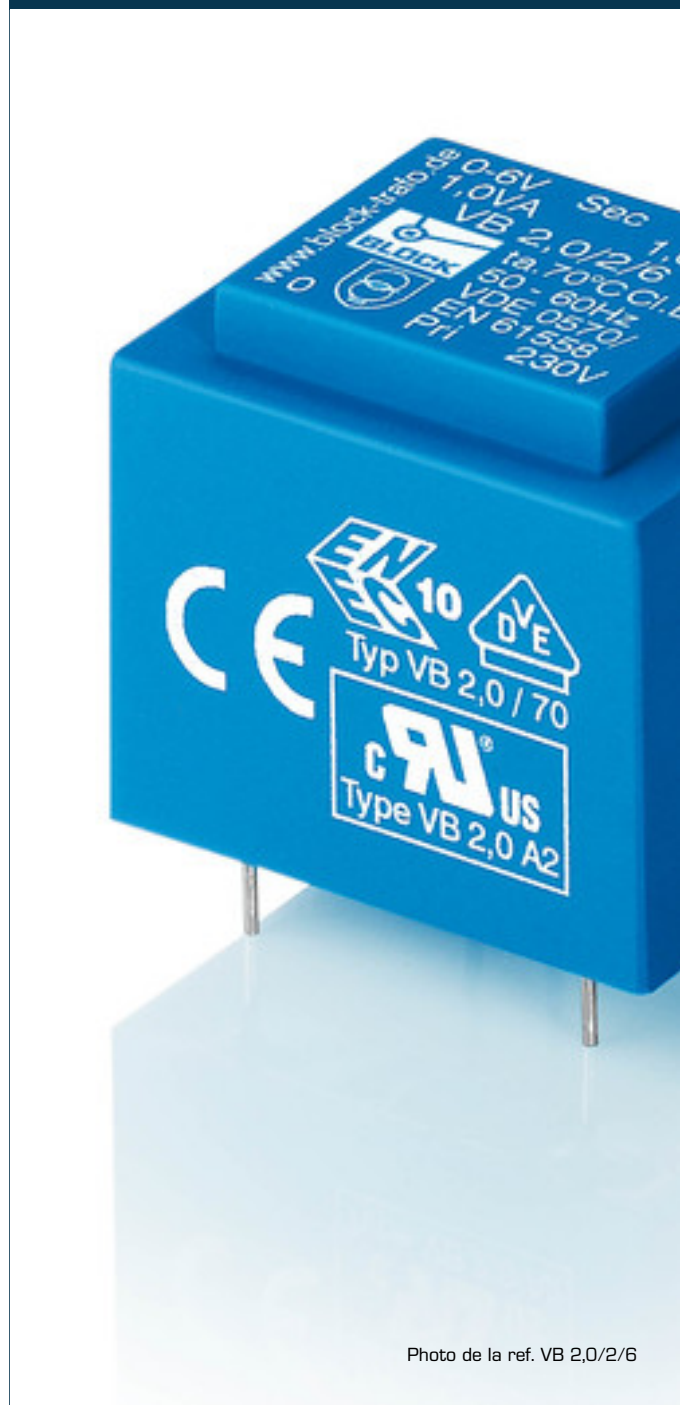
Photo de la ref. VB 2,0/2/6