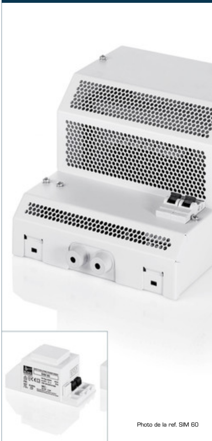
Photo de la ref. SIM 60