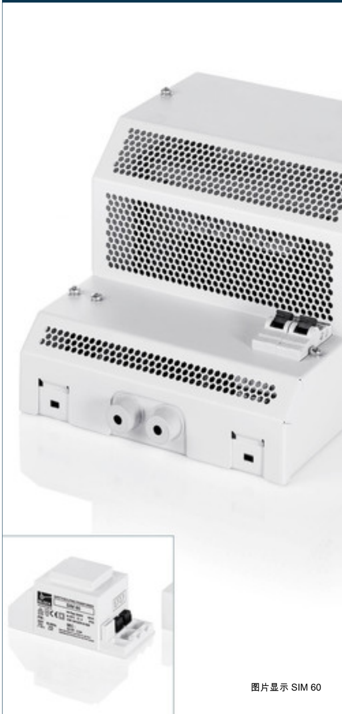
图片显示 SIM 60