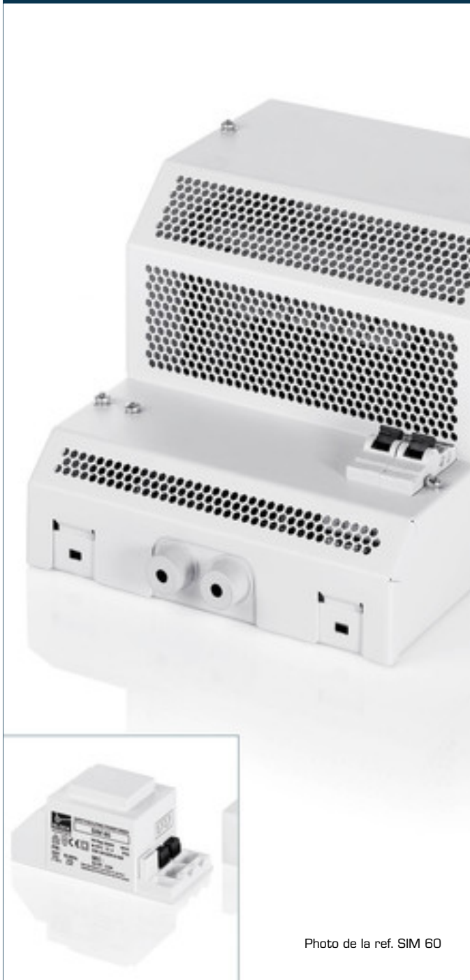
Photo de la ref. SIM 60