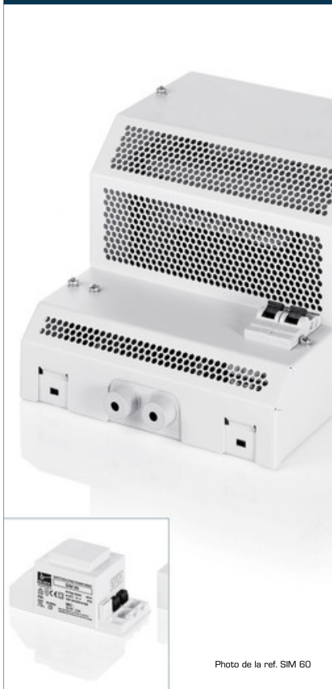
Photo de la ref. SIM 60