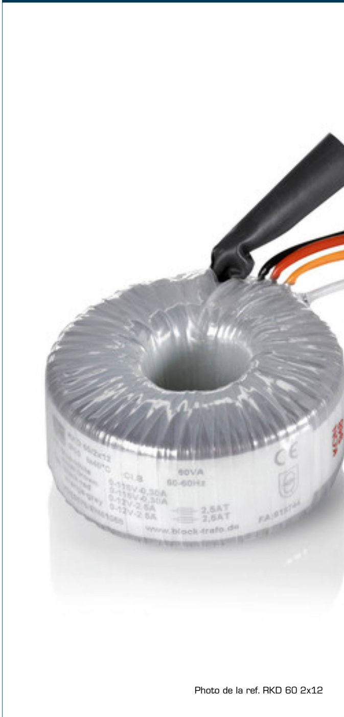
Photo de la ref. RKD 60 2x12