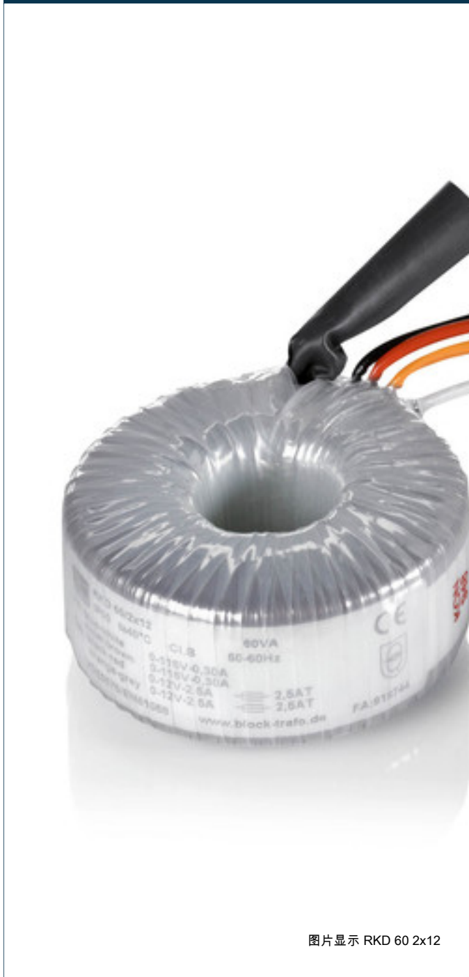
图片显示 RKD 60 2x12