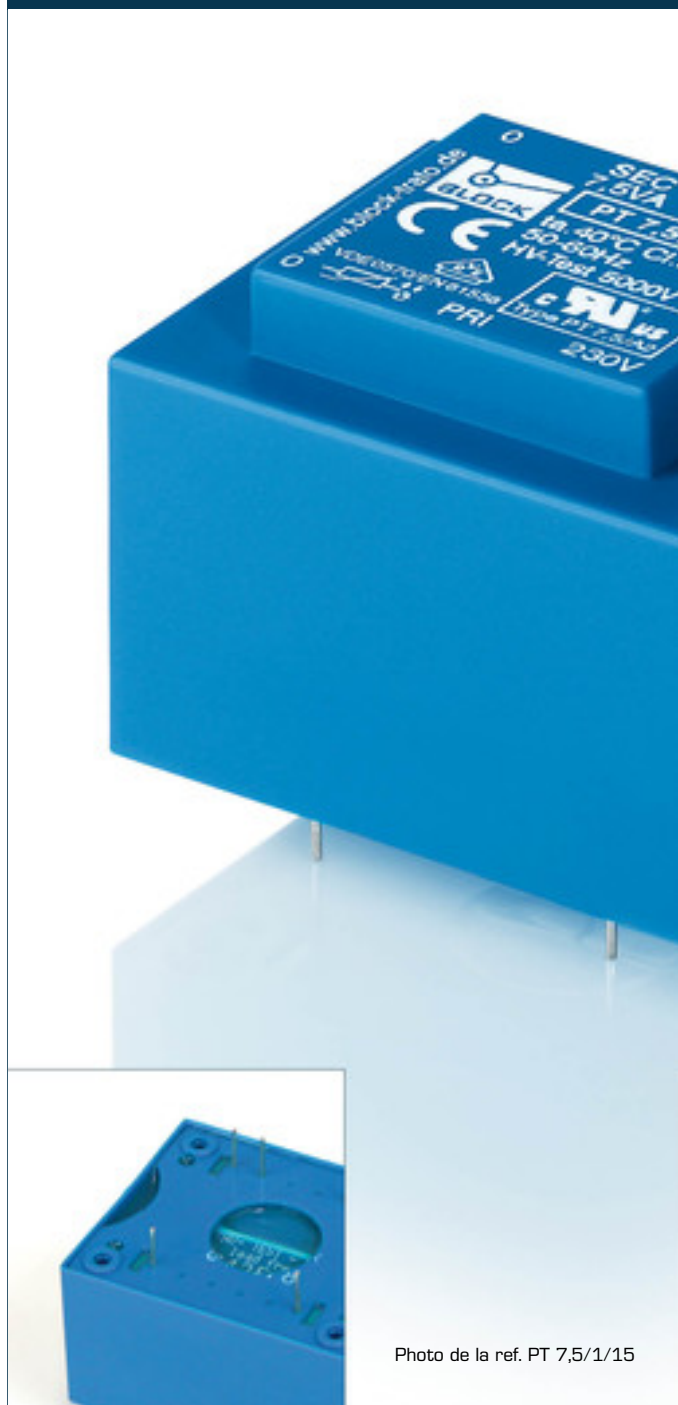
Photo de la ref. PT 7,5/1/15