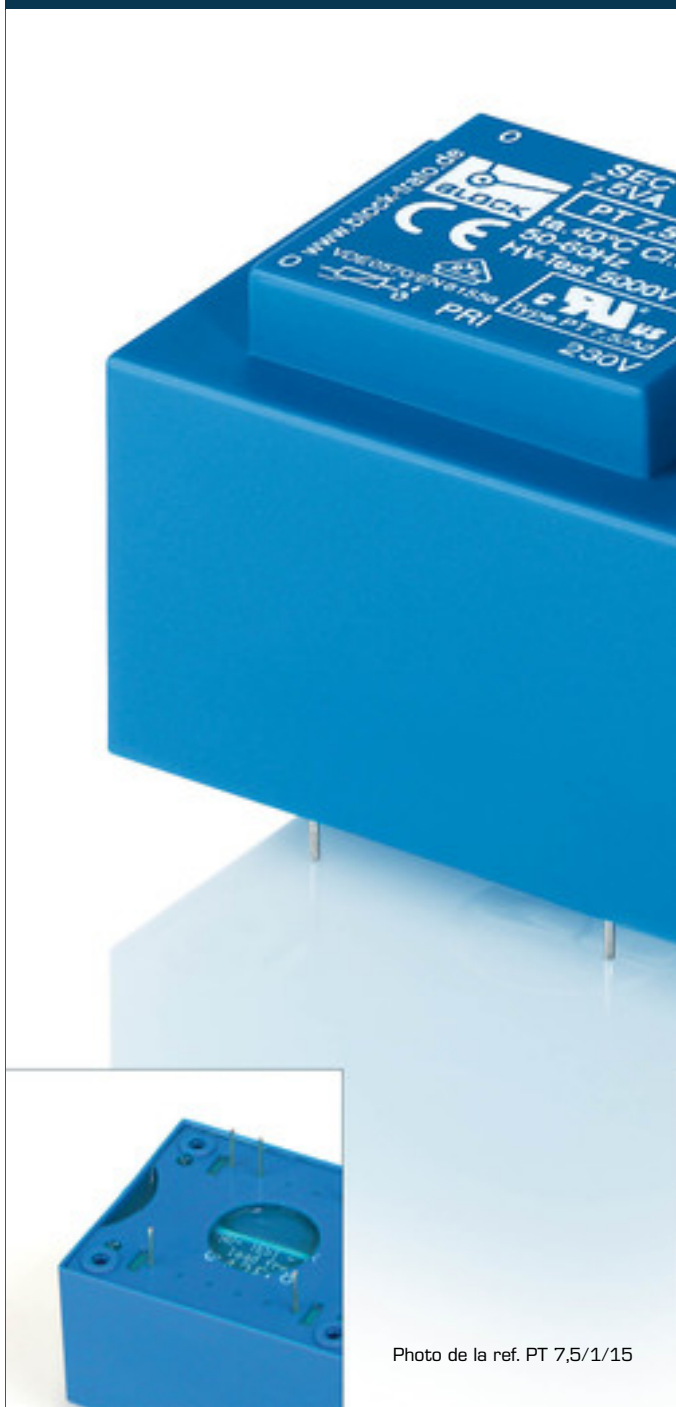
Photo de la ref. PT 7,5/1/15