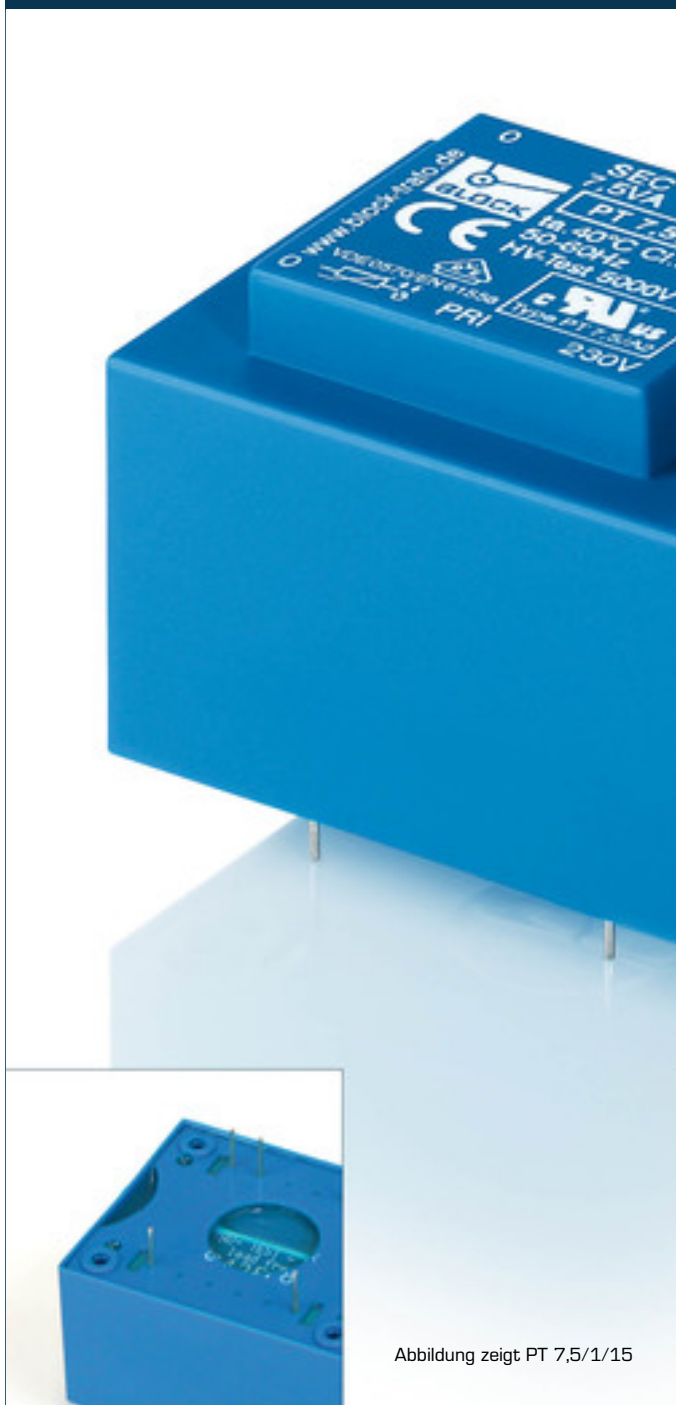
Abbildung zeigt PT 7,5/1/15