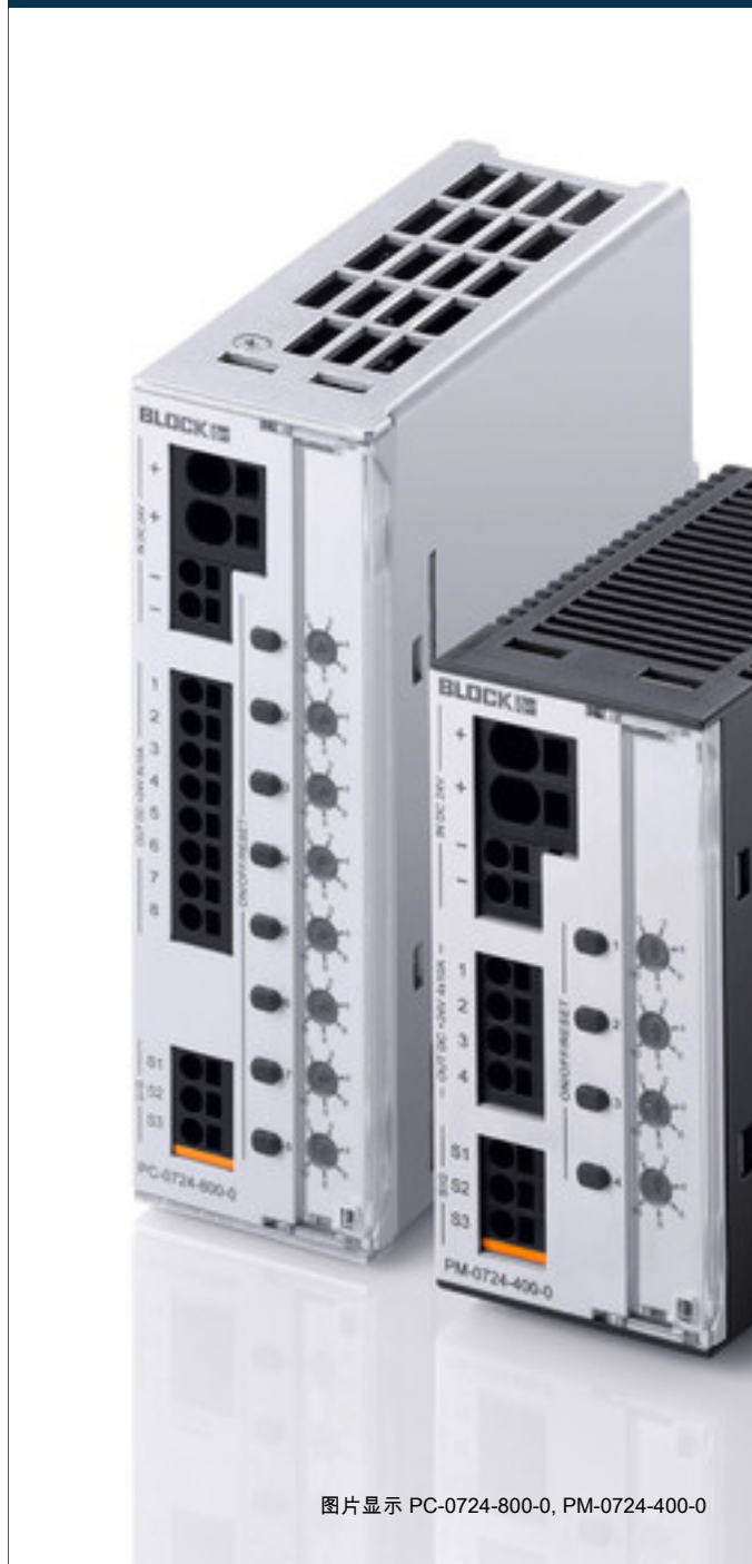
图片显示 PC-0724-800-0, PM-0724-400-0