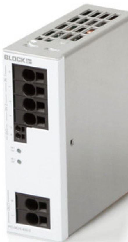
Photo de la ref. PC-0624-400-0