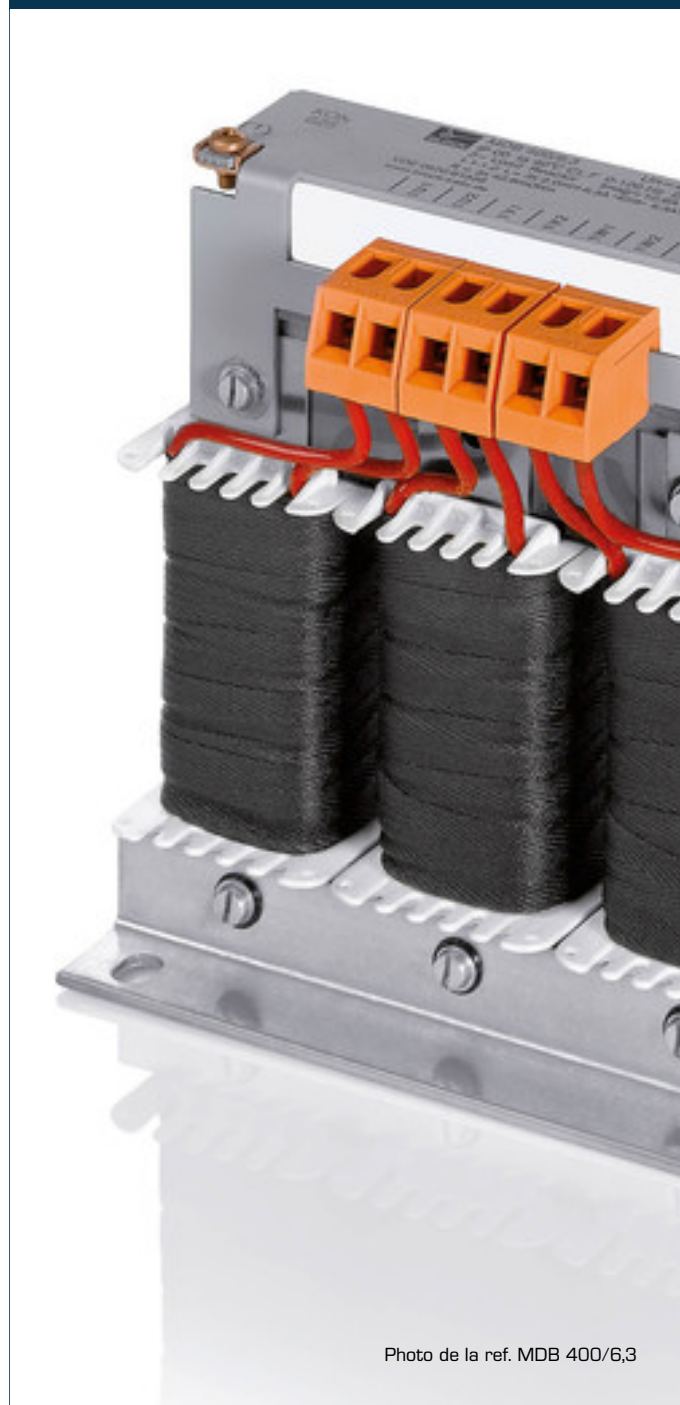
Photo de la ref. MDB 400/6,3