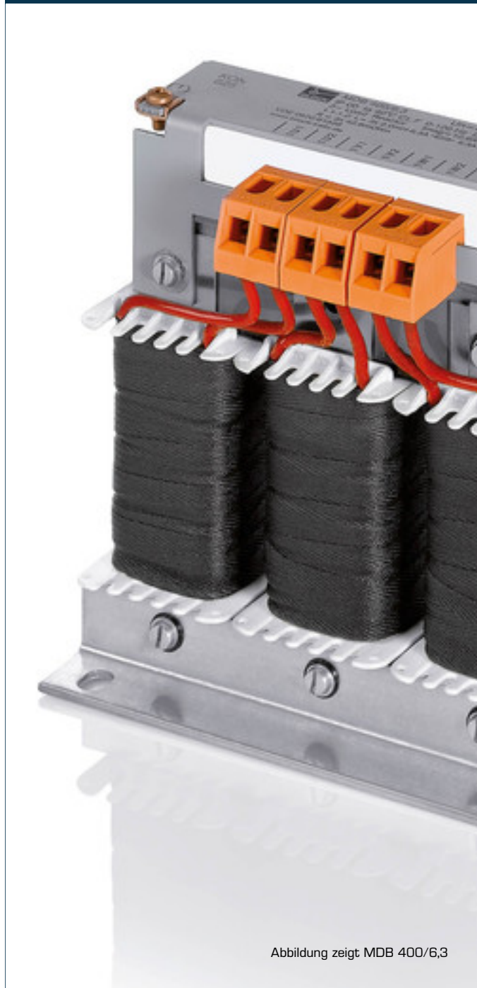
Abbildung zeigt MDB 400/6,3