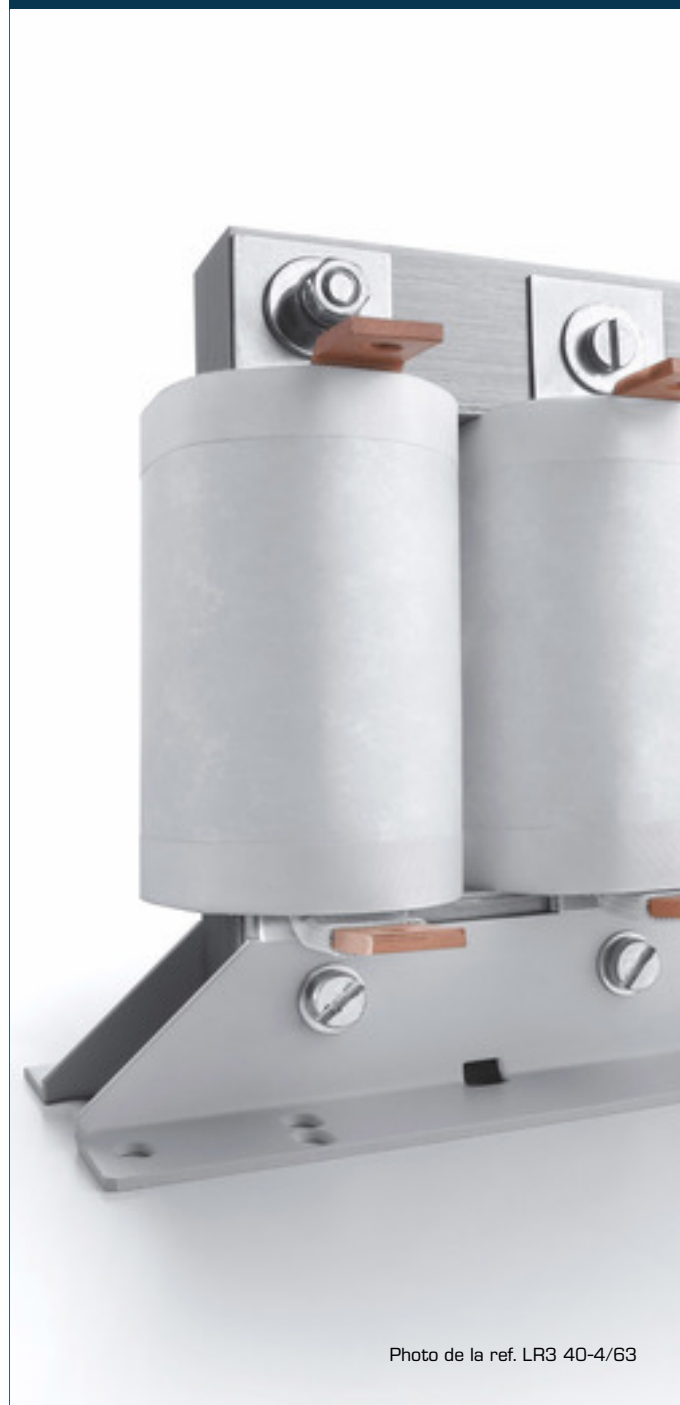
Photo de la ref. LR3 40-4/63