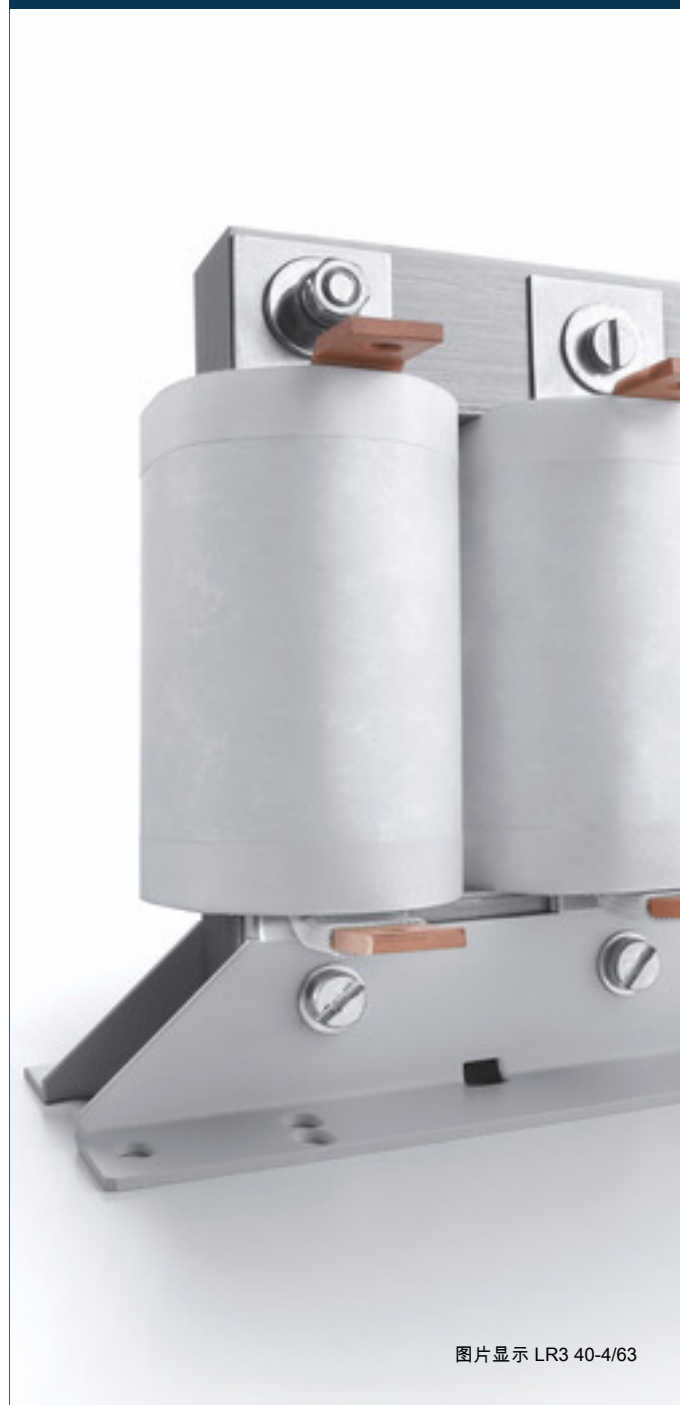
图片显示 LR3 40-4/63