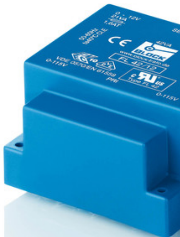
Photo de la ref. FL 42/12