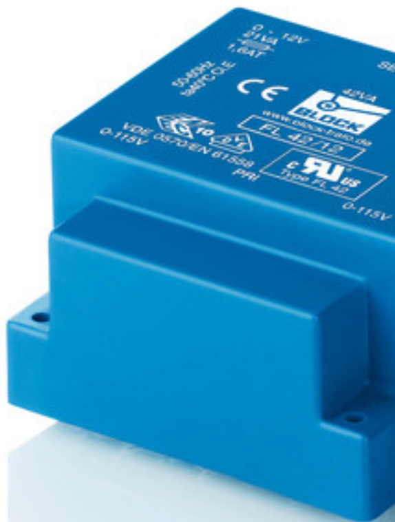
Photo de la ref. FL 42/12