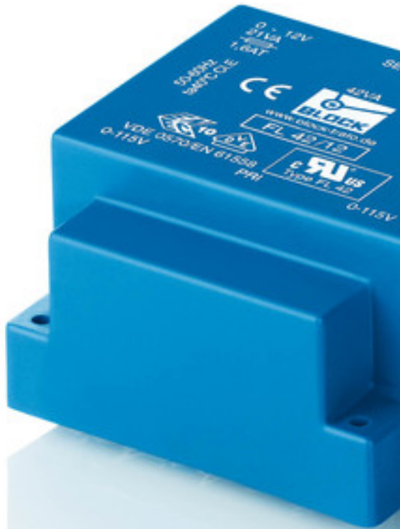
Photo de la ref. FL 42/12