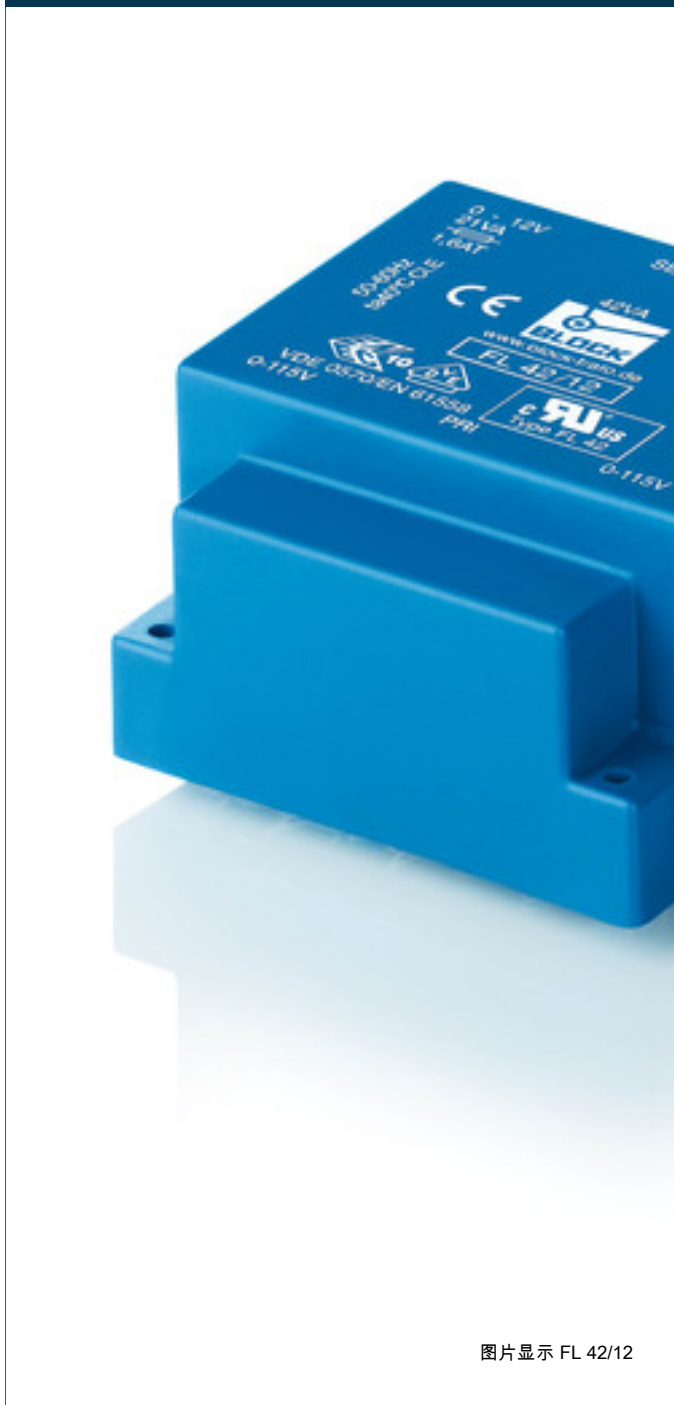
图片显示 FL 42/12