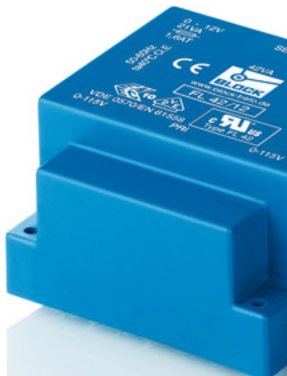
Photo de la ref. FL 42/12