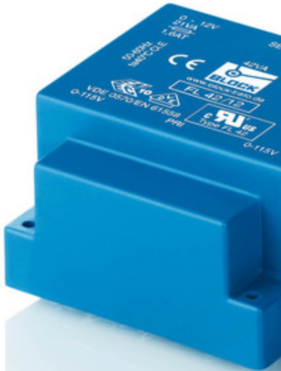
图片显示 FL 42/12