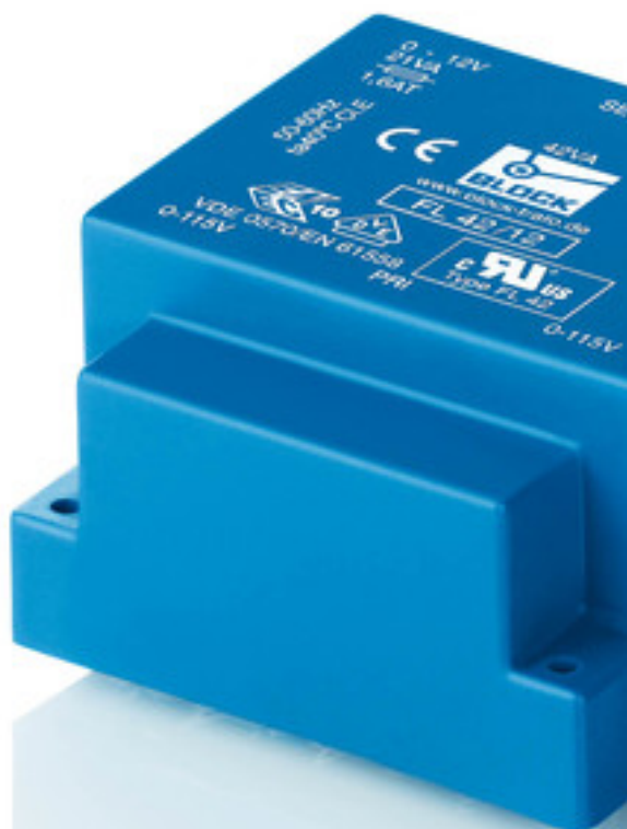
Photo de la ref. FL 42/12