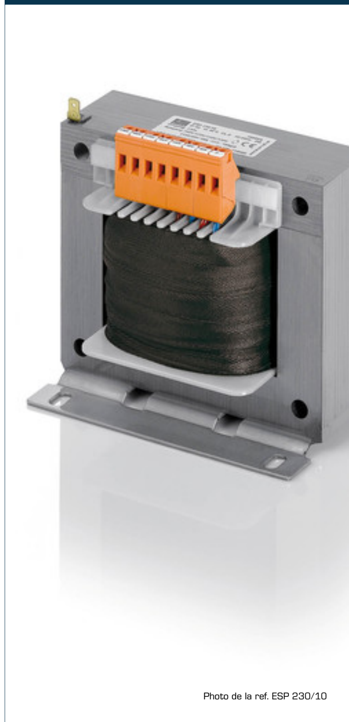
Photo de la ref. ESP 230/10