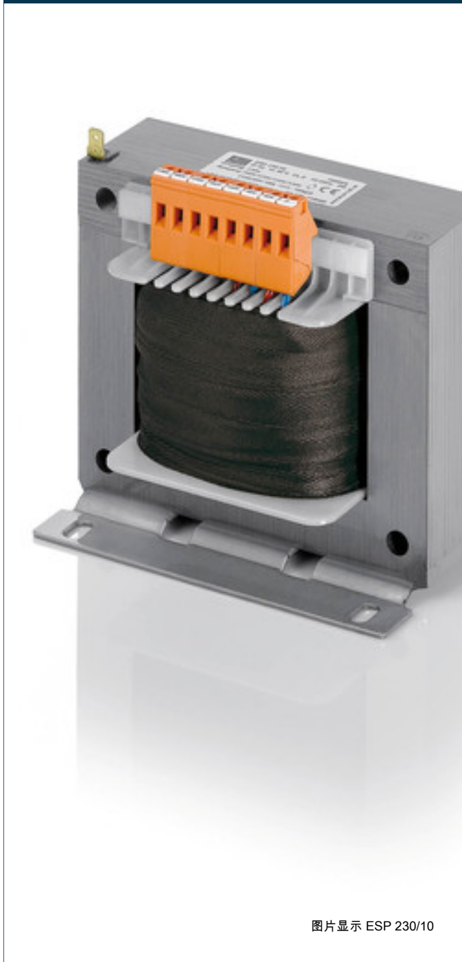
图片显示 ESP 230/10