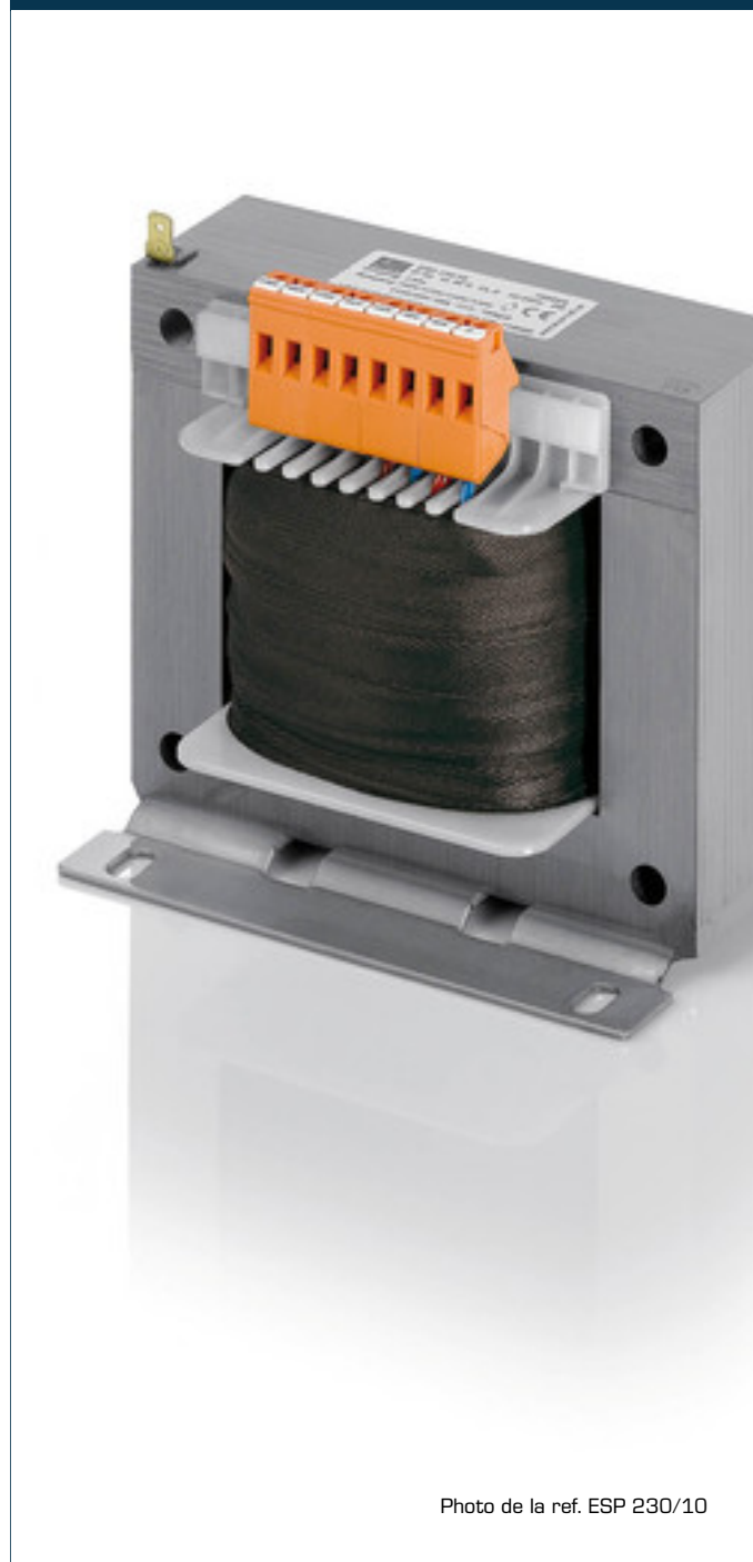
Photo de la ref. ESP 230/10