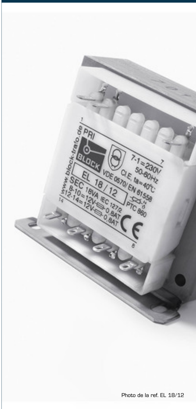
Photo de la ref. EL 18/12