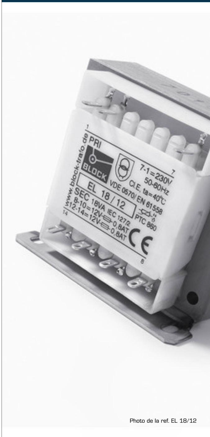
Photo de la ref. EL 18/12