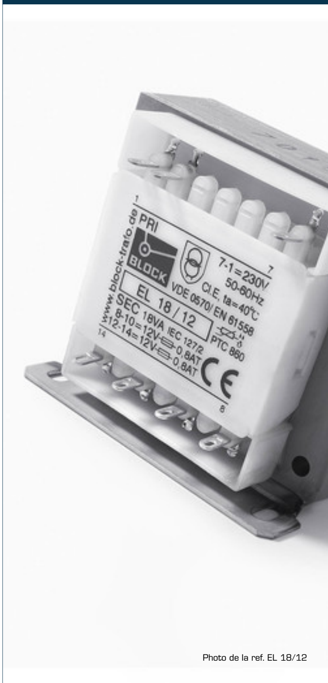
Photo de la ref. EL 18/12