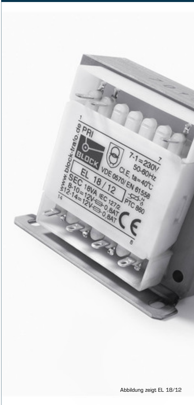
Abbildung zeigt EL 18/12