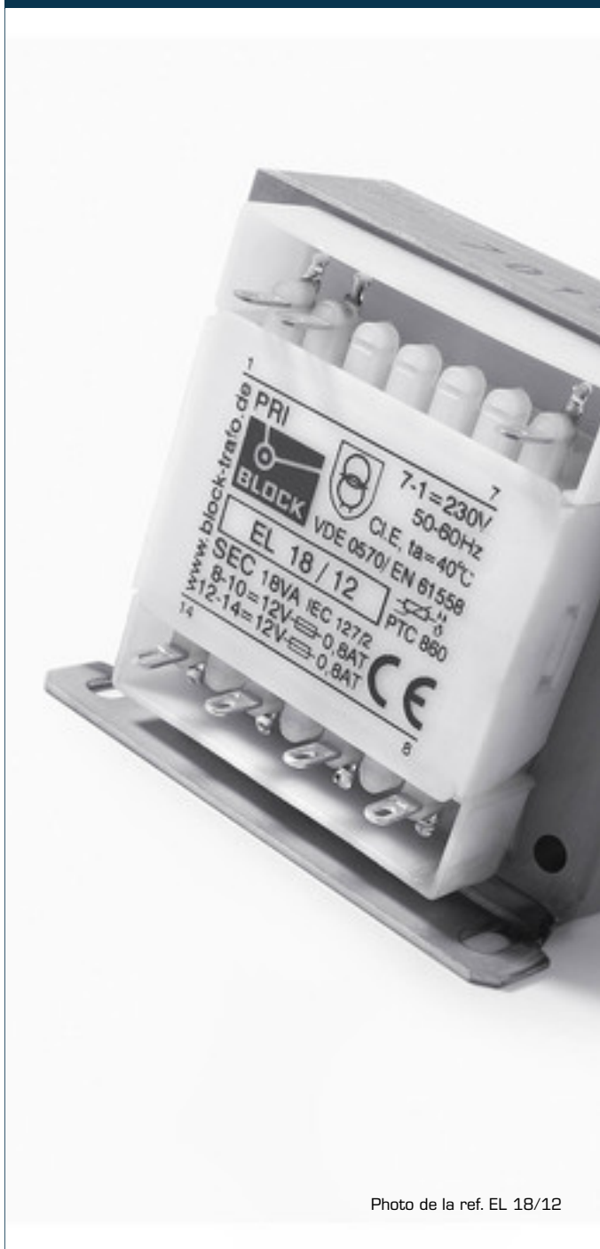
Photo de la ref. EL 18/12